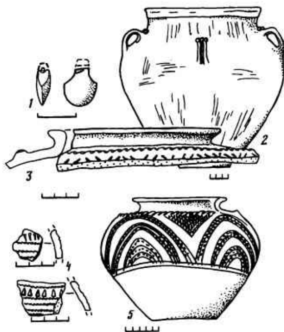
Р и с. 2. Датирующие находки из второго слоя поселения Старчики

I — сердоликовая подвеска; 2-5 — глиняные сосуды и их фрагменты