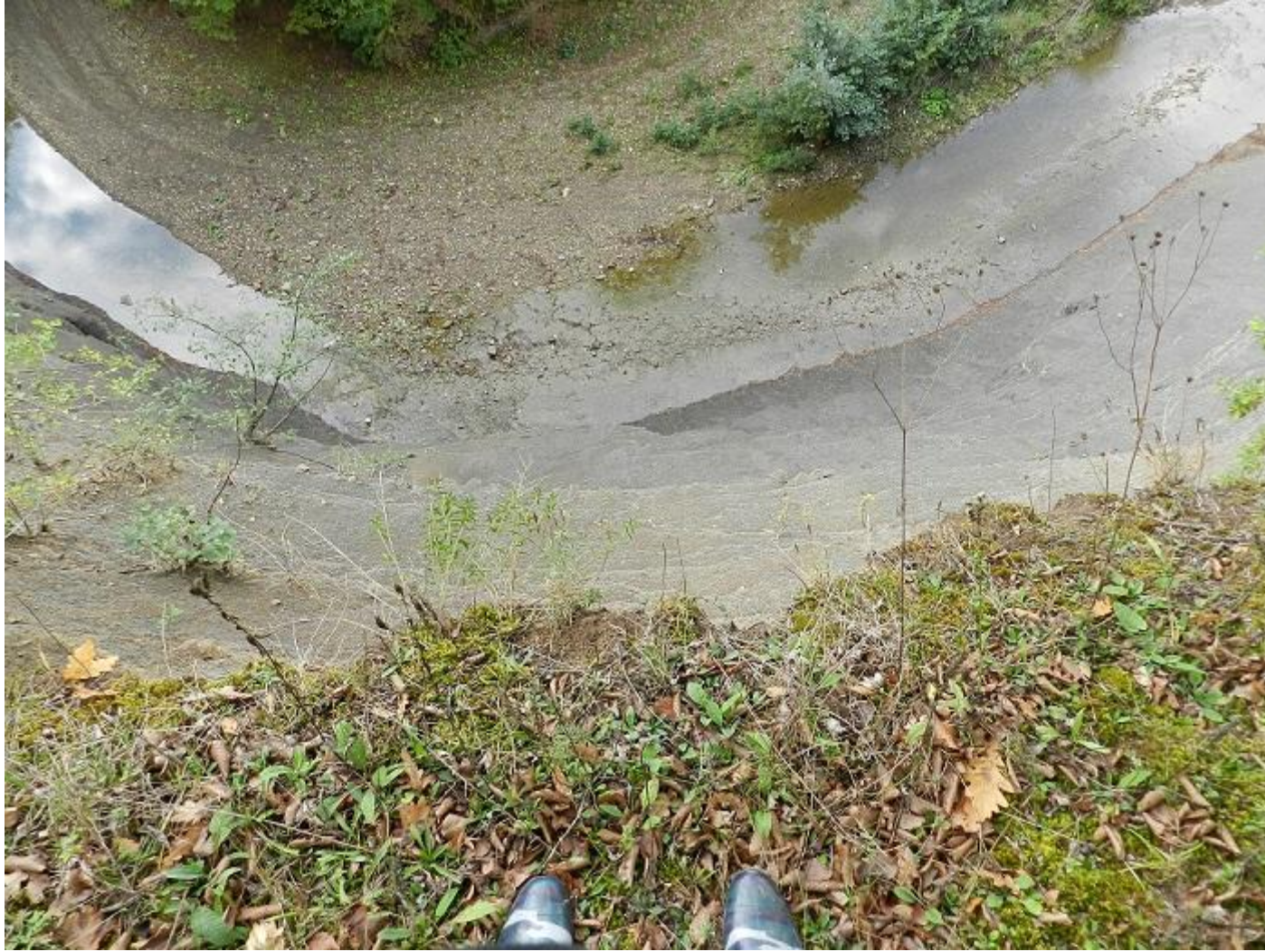
Обрывистый высокий берег реки