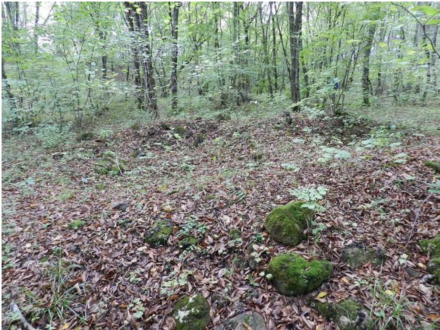
Один из разрытых курганов