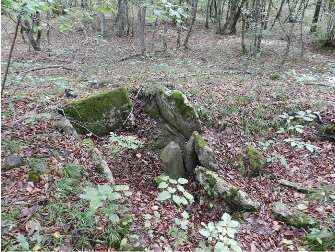
Ещё один порталный дольмен