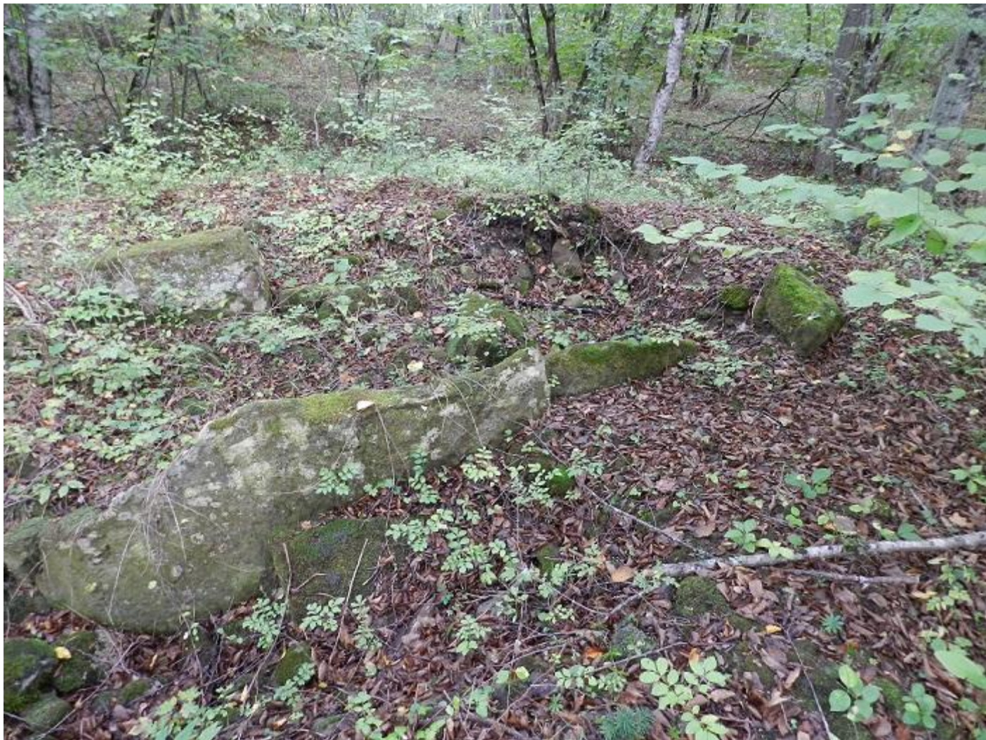
Остатки порталного дольмена