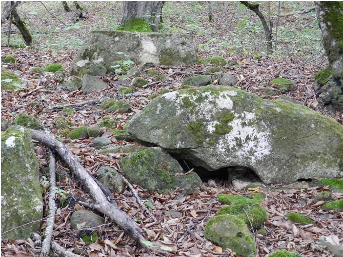
Развал дольмена. Обломок фронтальной плиты с наметком входного отверстия