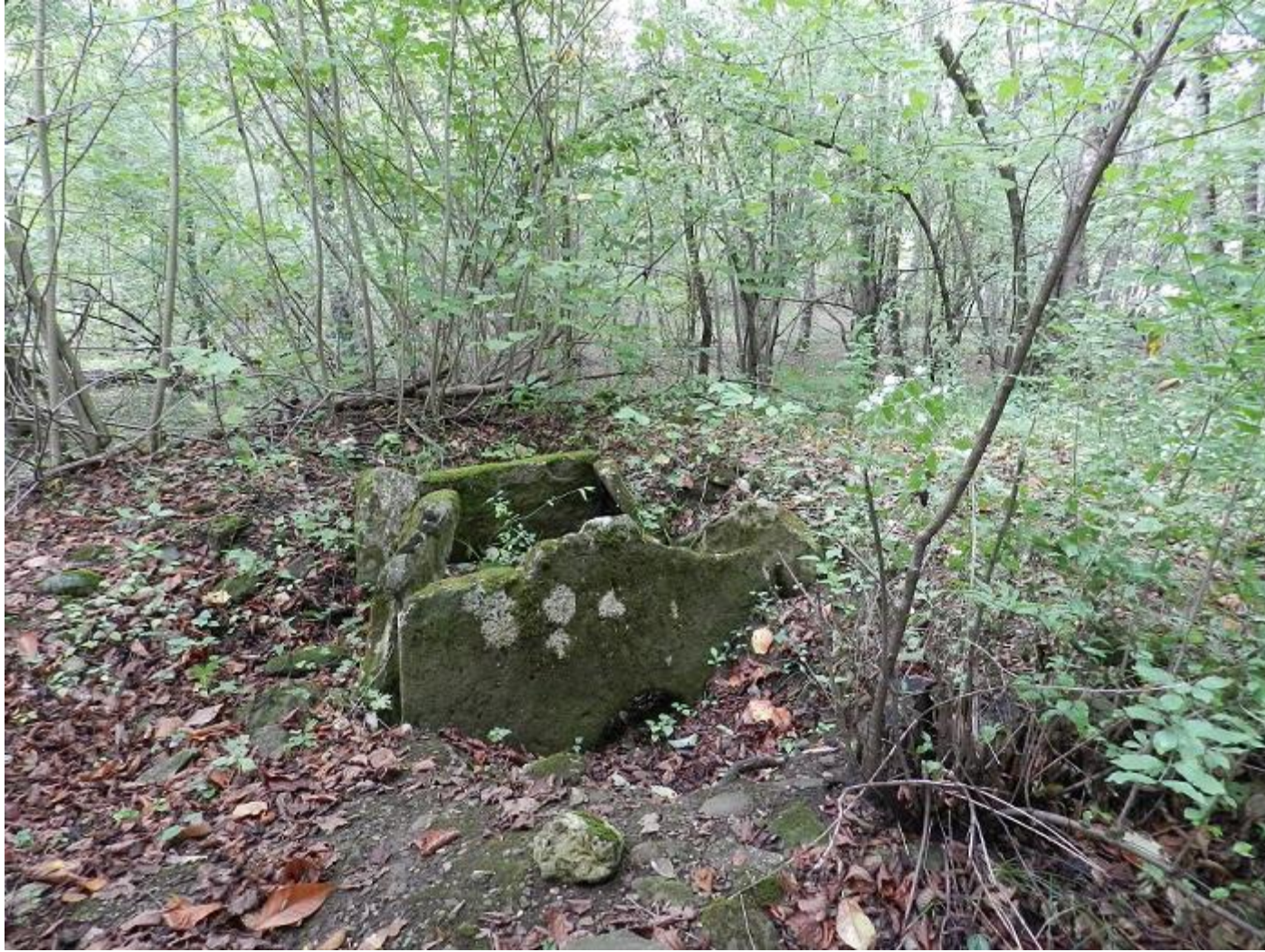
Классический плиточный дольмен