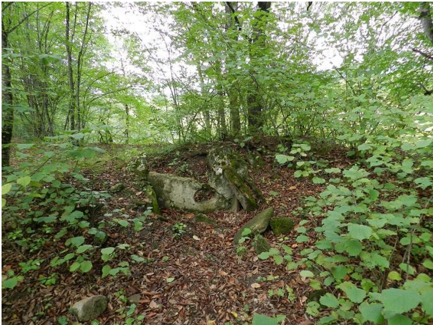
Вероятно развал дольмена №4 порталного типа