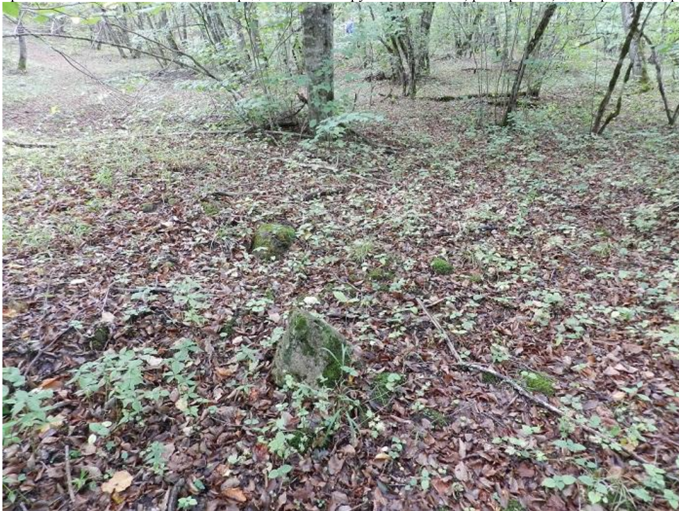
Многочисленные обломки дольменных плит, фрагменты менгиров и остатки булыжных насыпей

практически не позволяет точно определить тип сооружения. То есть, разобраться, где портал, где дромос, а где ящик можно только примерно.