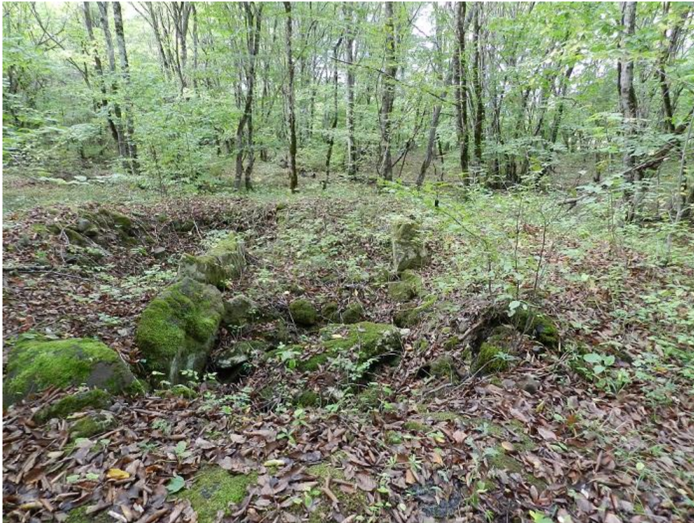
Что-то похожее на коридор-дромос?