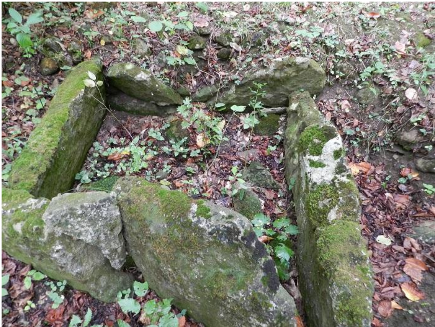
Возможно, тот самый каменный ящик?