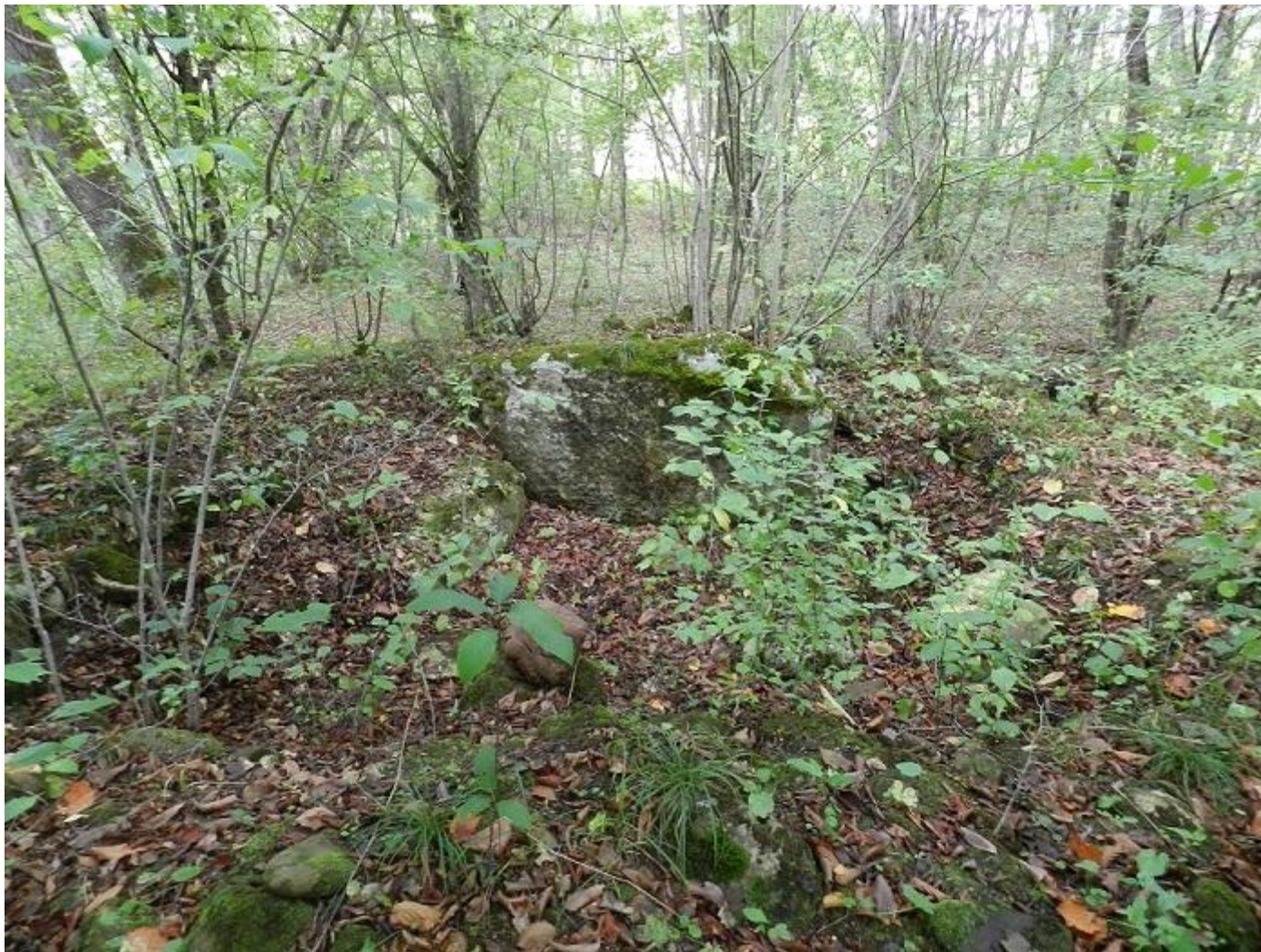
Развал дольмена. Рядом лежит шарообразный каменный предмет красноватого оттенка, возможно заготовка под втулку