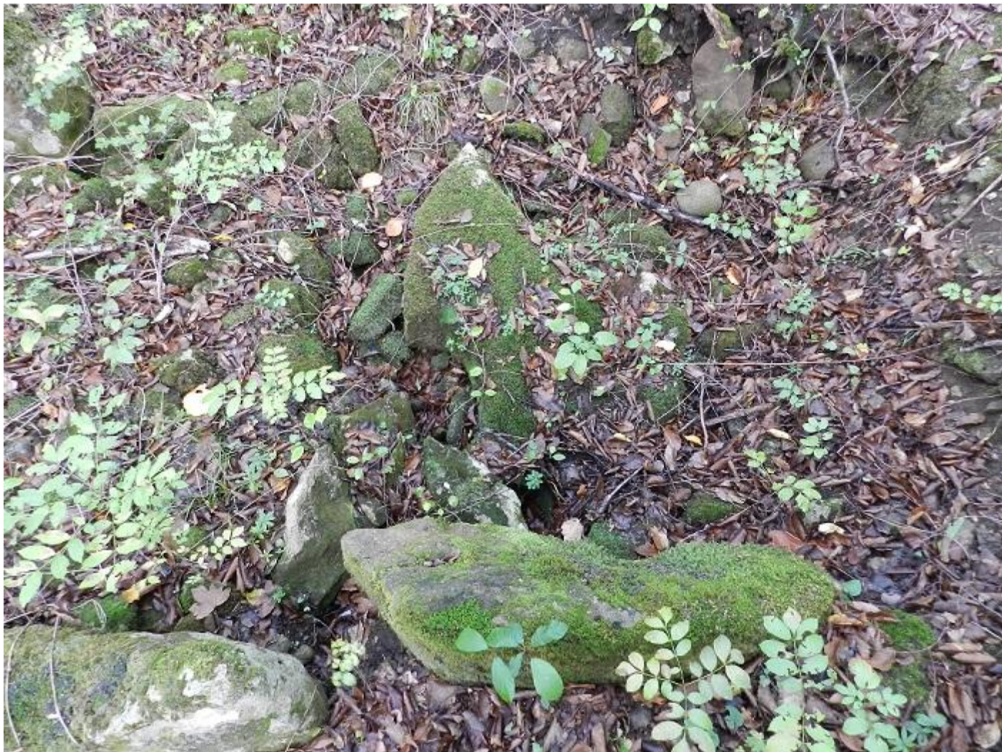
Обломки чьей-то фронтальной плиты...