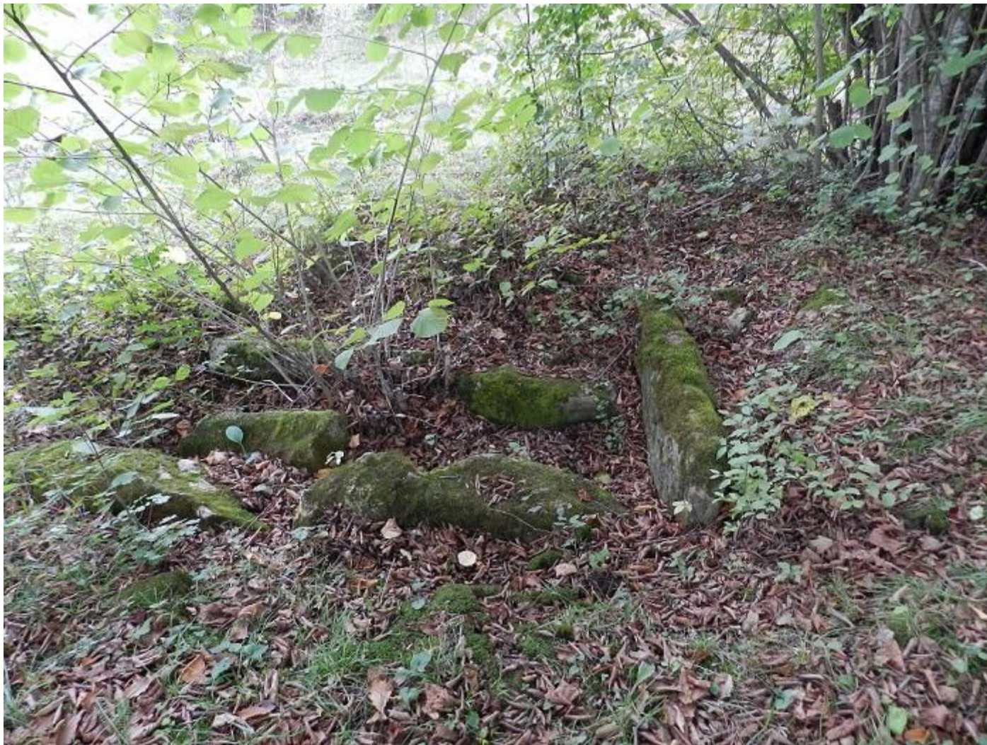
Те же руины, с другого ракурса