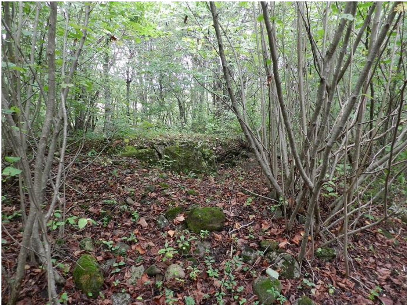
Нечто похожее на двухкамерную гробницу...