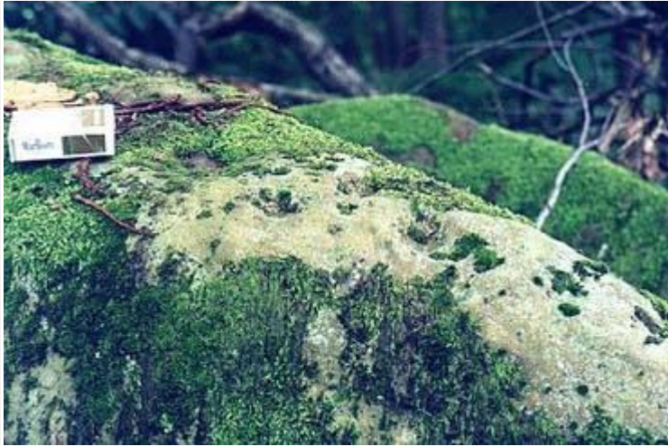
Чашевидные метки (лунки) на валуне рядом с дольменом (слева от дольмена).