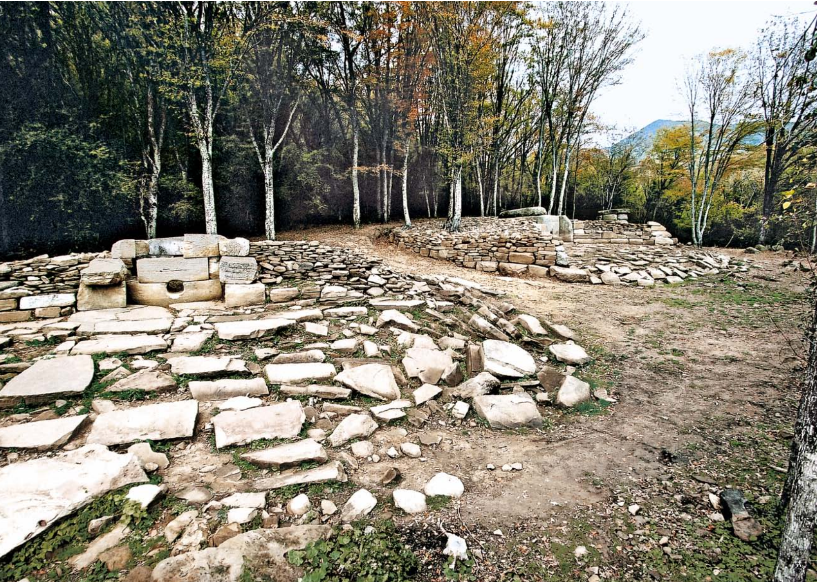
Рис. 4. Дольменная группа Жане, вид с юго-запада. На переднем плане дольмен 3, 2000 г.

тщательно обработанных и подогнанных друг к другу песчаниковых плит, с примыкающим к фасадной части мощеным двором, огражденным стеной из обработанных блоков (рис. 5–7). По наружному периметру размеры дольмена равняются приблизительно 3,6 \times 3,9 м. Высота дольмена от пола погребальной камеры до наружной поверхности плиты перекрытия составляет около 2,4 м. Толщина плит колеблется от 40 до 60 см.