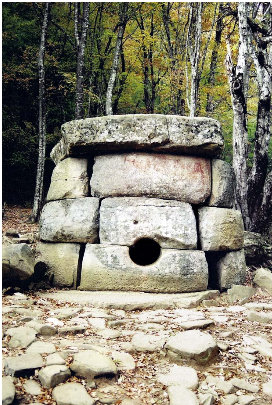
Рис. 10. Дольменная группа Жана. Дольмен 1 после завершения восстановительных работ, 1998 г.

0,4 м. На поверхности плит фундамента по периметру выбит широкий (40–45 см) неглубокий (1–1,5 см) паз с точной разметкой под каждый из четырех блоков нижнего яруса стен дольмена. Блоки были уложены насухо, с поярусным перекрытием стыков между ними. На горизонтальных поверхностях всех блоков сохранились следы их индивидуальной подгонки друг к другу в виде неглу-