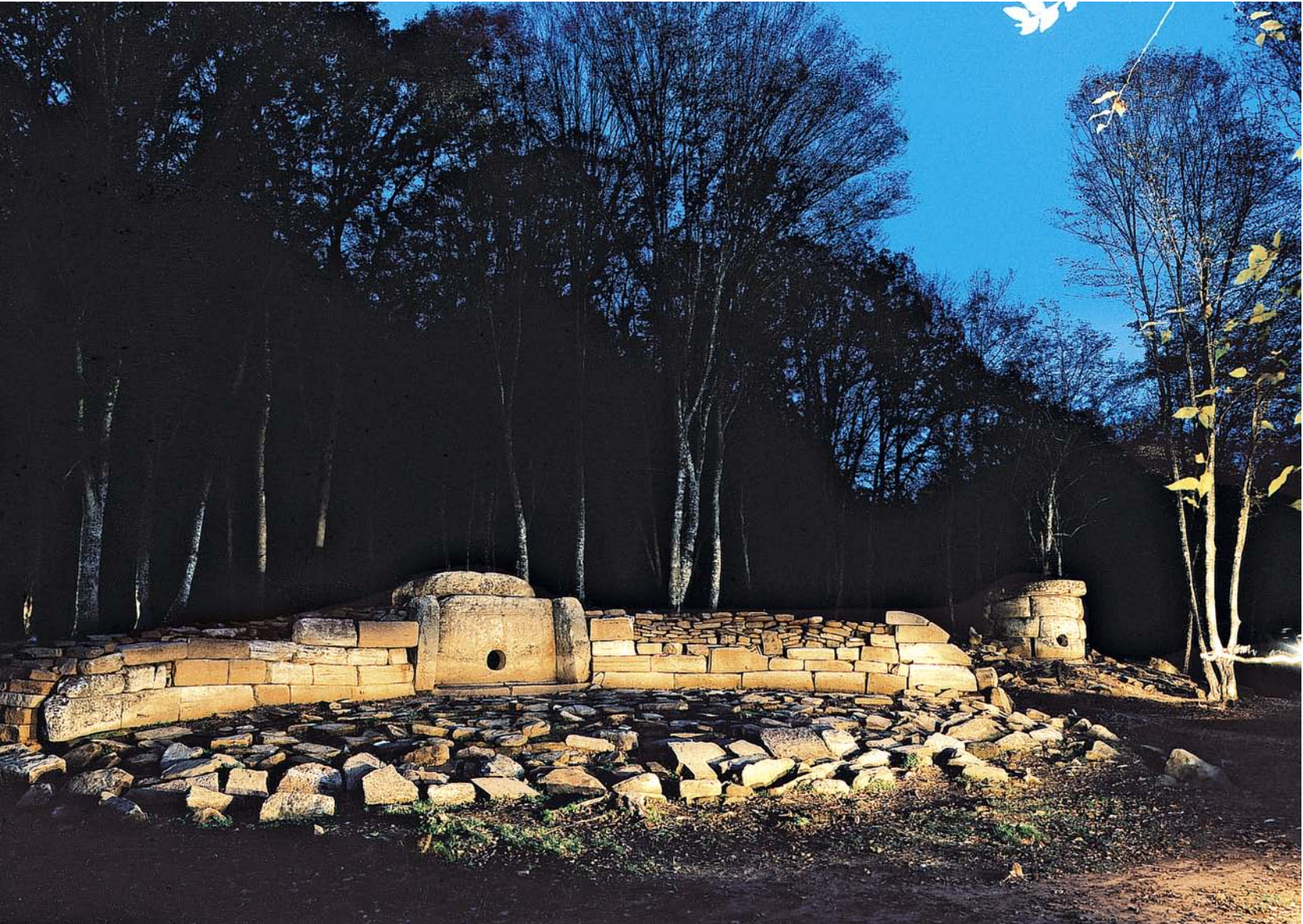
Рис. 5. Дольменная группа Жане. На переднем плане дольмен 2, вид с юга, 2000 г.

0,44 м, в основании — 0,4 м, в верхней части — 0,3 м. Разница в толщине возникла за счет придания наружной поверхности плиты выпуклой формы как в продольном, так и в поперечном сечениях. В 0,3 м от нижнего края плиты, на равном расстоянии от боковых сторон, в плите сделано круглое сквозное отверстие, диаметром 40 см. Край отверстия снаружи и изнутри сильно заглажен. Отверстие закрывалось каменной пробкой, часть которой была найдена.