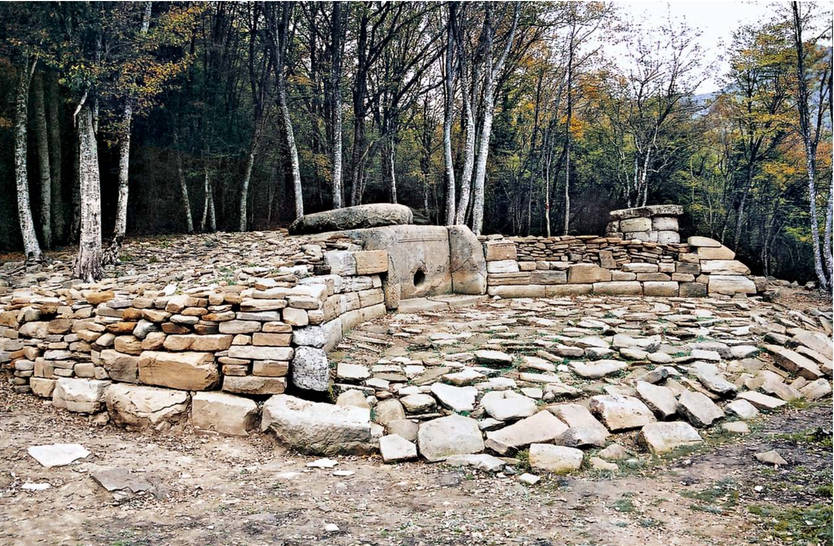
Рис. 6. Дольменная группа Жане. Дольмен 2, вид с юго-запада, 2000 г.