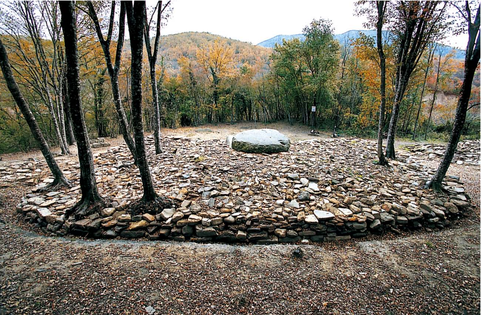
Рис. 7. Дольменная группа Жане. Дольмен 2, вид с северо-запада, 2000 г.

вторичной обработки плит дольмена. Пространство между контрфорсами, стенами дольмена и плитой фундамента было заполнено тщательно уложенным под углом мелким ломаным песчаниковым плитняком.