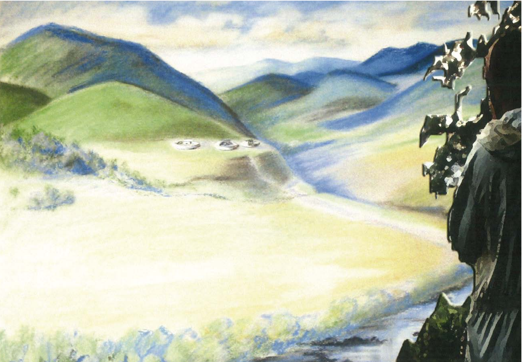
Рис. 13. Долина реки Жане в эпоху бронзы. Рисунок Н. Ю. Косьянковой.

группы, закругленные контуры наружного края плит его фундамента и перекрытия, как и уплощенный фасад с закругленными углами дольмена с круглой камерой, не связаны с конструктивной прочностью дольменов и являются собой скорее рудиментарные атрибуты консервативного по своей природе культового мегалитического строительства.