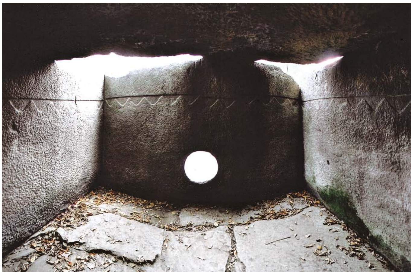
Рис. 9. Дольменная группа Жане. Погребальная камера дольмена 2, 2000 г.

двора составляет всего около 40 см, тогда как снаружи — около 1 м. Наружная сторона блоков всех трех ярусов скруглена таким образом, что составляет единую плоскость полукруглого в плане, тщательно обработанного пикетажем фасада. Качество обработки наружной поверхности фасадной стены двора не уступает качеству обработки фасадных поверхностей дольмена и внутренних стен двора.