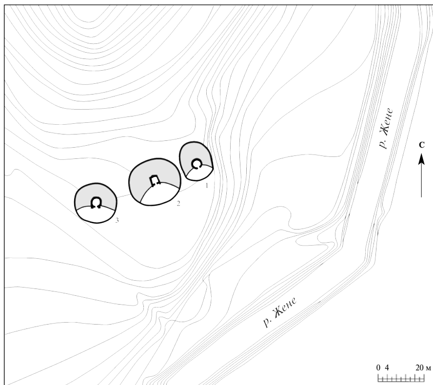
Рисунок 1. Правый берег долины реки Және, дольменная группа 1.

Часть блоков повреждена и раскидана вокруг дольмена на расстоянии 5–10 м. В еще большей степени пострадал дольмен 1. У него были обрушены стены и перекрытие. Поскольку он находился на краю крутого разрушающегося склона, существовала опасность полного обрушения плиты перекрытия (весом около 8 т) и блоков стены. Некоторые из них уже сползли вниз по склону на 20–25 м.