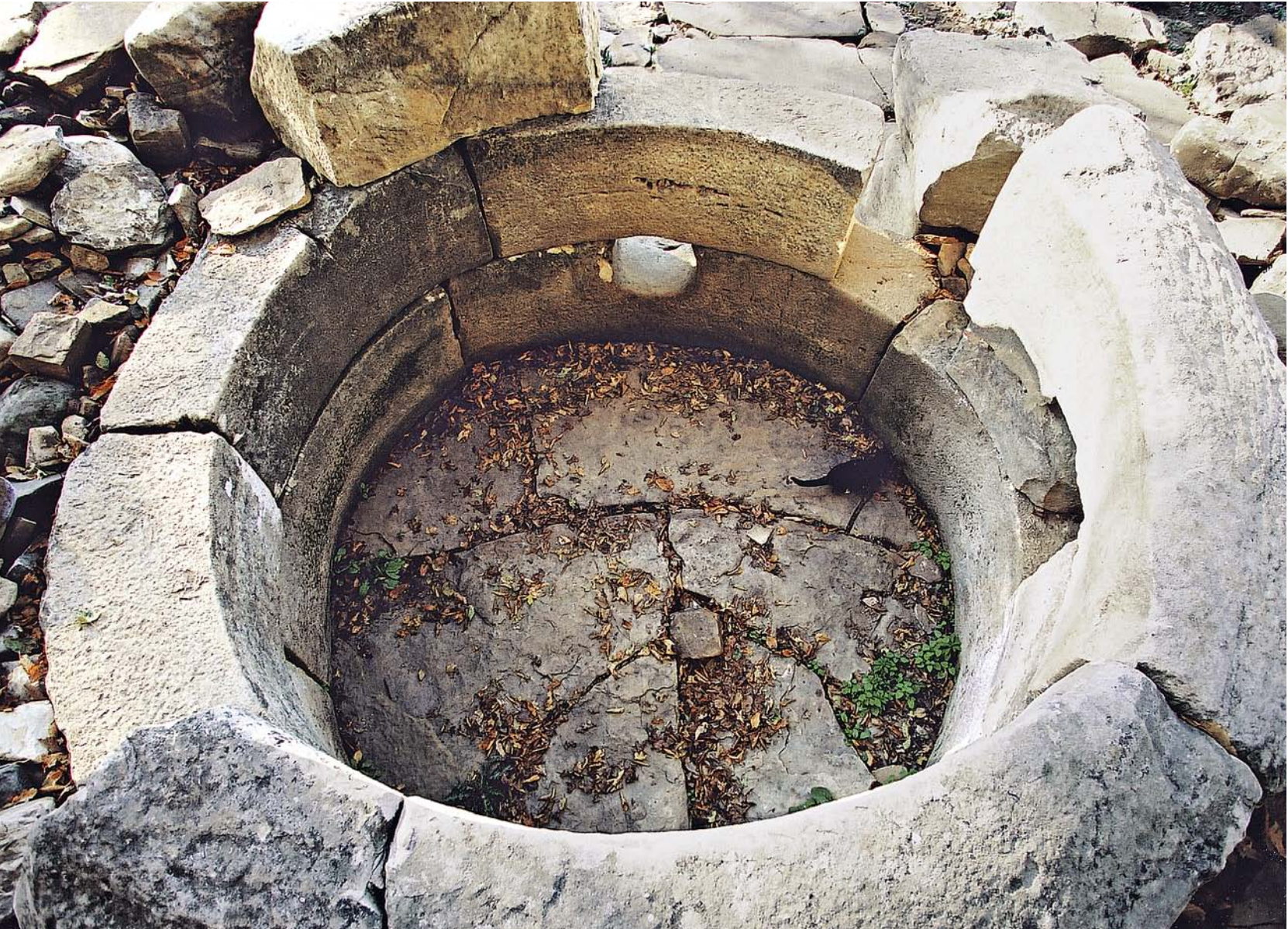
Рис. 11. Дольменная группа Жане. Погребальная камера дольмена 3, 2000 г.

камеры наклонного участка плиты фундамента. У дольмена 3 отстка шириной 0,5 м, с перепадом высот около 10 см, начинается перед порталом, что косвенным образом указывает на размеры козырька над фасадом. О размерах несохранившейся плиты перекрытия можно судить по пазам на верхней поверхности блоков портала. Если расчеты верны, то плита перекрытия была примерно около 4,5 м длиной и 3,8 м шириной. Она была уложена наклонно, с перепадом по высоте от фасада к задней стенке в 12–13 см. Следует отметить, что если внутренние контуры камер дольменов 1 и 3 представляют собой в плане почти идеальную окружность, то наружные заметно отличаются друг от друга. В то время как